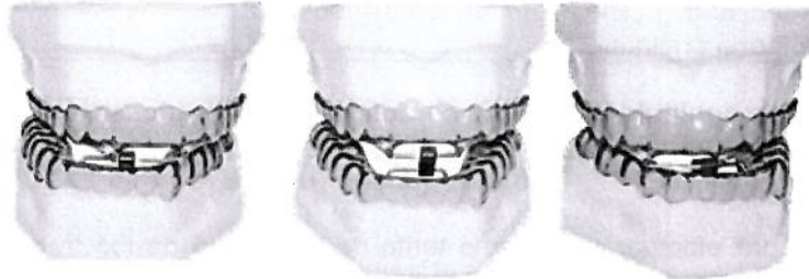
Foto referencial (hay múltiples modelos, debe describir la que trabaja al momento de ofertar en la licitación):

El Hospital se reserva la posibilidad de reducir o aumentar el número de aparatos según la necesidad de demanda del servicio o disponibilidad de recursos de este.